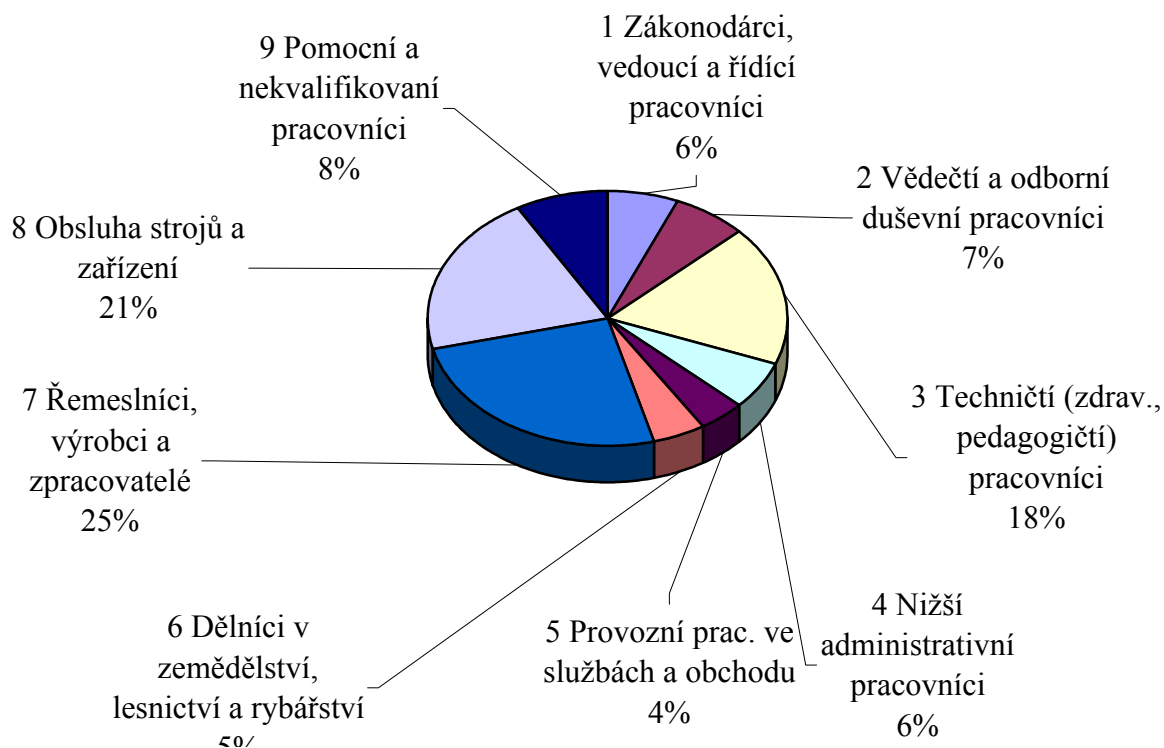
Struktura zaměstnanců dle hlavních tříd KZAM - R