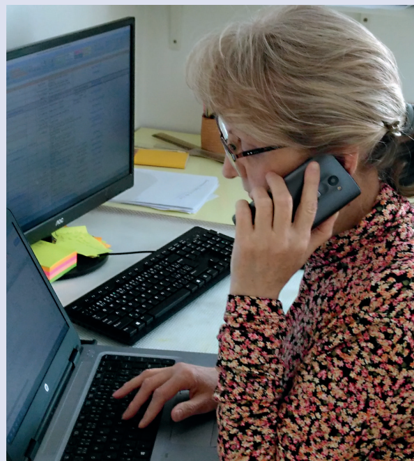
Jak to vypadá, když pomáháme na lince 1212

Dotaz: Na linku 1212 se dovolal pán v krizové situaci. Byl velice nešťastný, úzkostný, bál se nákazy a uváděl, že má finanční problémy a neví, jak zvládne žít dál.