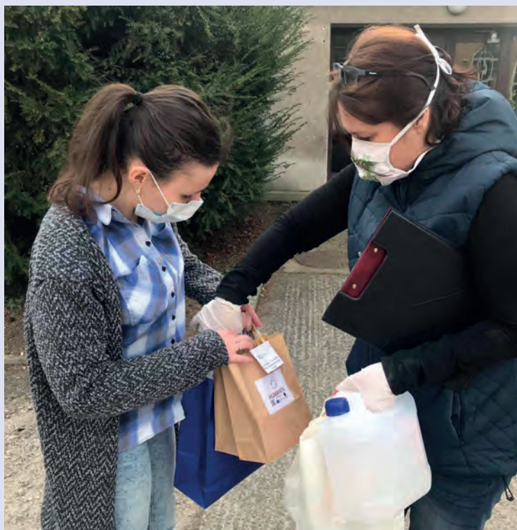
Studenti ACSA – Jihomoravský kraj

pomoci v aktuální nouzové situaci. Cílem tohoto portálu je zaznamenat, roztřídit a propojit dobrovolníky s žádostmi o pomoc. Toto propojení je kontrolováno proškolenými operátory tak, aby nebyl žádný požadavek opomenut. Portál je opravdu jednoduchý, úvodní stránka nabízí dvě části – Nabízím pomoc a Potřebuji pomoc. Vyplněním jednoduchého formuláře je následně pomoc roztříděna do několika „nejpalčivějších“ oblastí. V počátcích tohoto projektu se do něj zapojili jako dobrovolníci studenti, studentské organizace a univerzity. Později se přidaly také městské úřady a celé kraje. Registrovalo se přes 4000 dobrovolníků. V Jihomoravském kraji, kde má organizace své sídlo, má portál dobrovolníků nejvíce. Mladí lidé tak svojí ochotou a srdcem pomáhají zvládnout tuto tíživou situaci jiným, zejména seniorům.