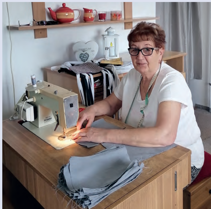
Seniorka šije roušky – Moravskoslezský kraj

Dobrovolnické programy jsou zaměřeny na pomoc osobám sociálně slabým, nezaměstnaným, zdravotně postiženým, seniorům, příslušníkům národnostních menšin, imigrantům, pomoc s péčí o děti a mládež, rodiny apod. Dále jsou zaměřeny na