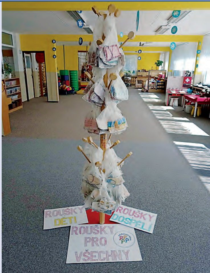
MŠ Vítězná Sokolov šije roušky – Karlovarský kraj

balíčků potravin s maximální cenou do 500 korun a možnost vyzvednout léky. Další dobrovolníci se mohou hlásit.