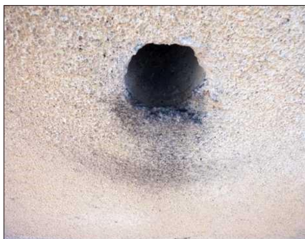
Znečištění fasády pod ventilačním otvorem způsobené otěrem rýdovacích per pěvců