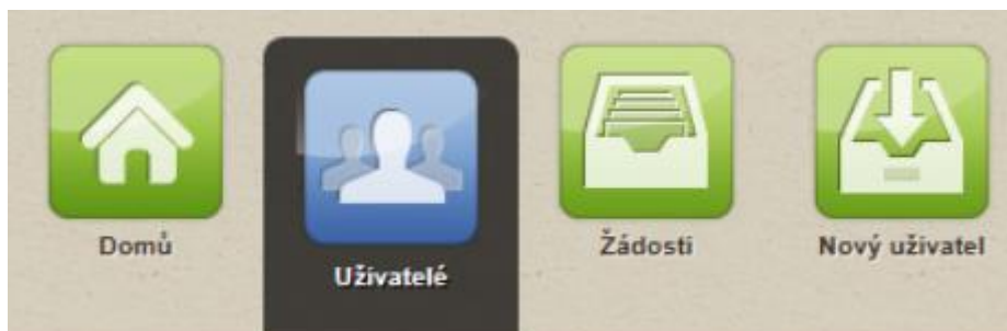
Obrázek 2: Menu - Uživatelé

Výběrem ikony Uživatelé v menu JSU, zobrazíte formulář „Seznam uživatelů“.