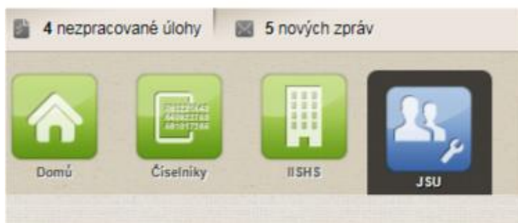
Obrázek 1: Menu – JSU

Výběrem ikony Uživatelé v menu JSU, zobrazíte formulář „Seznam uživatelů“.