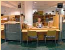
Jedno z nejmmodernějších klientůvých center ČSSZ v Českých Budějovicích

V letošním roce bylo už slavnostně otevřeno sedm nových pracovišť České správy sociálního zabezpečení. Jako sestě v pořadí bylo v polovině listopadu otevřeno jedno z nejmmodernějších pracovišť veřejné správy, a to v Českých Budějovicích. Klientské centrum je vybaveno informačním terminálem. Jeho prostřednictvím si lidé mohou nalézat informace na internetových stránkách ČSSZ či jiných veřejných správ. Moderním klientům centrem je i OSSZ v Náchodě, jejíž rekonstruovaná budova byla slavnostně otevřena 29. listopadu. Bylo pamatováno samozřejmě i na invalidní občany a do obou budov je bezbariérový přístup.