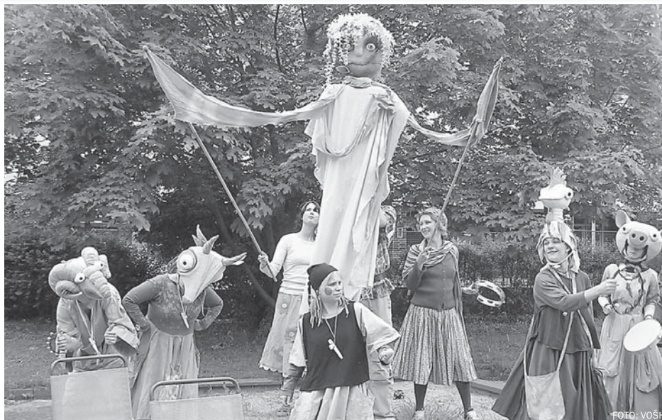
Pouliční divadlo – akce realizovaná 29. května t. r. v ulicích Prahy 4 byla prvním veřejně předváděným výstupem projektu. Zhlédlo ji asi 400 diváků.