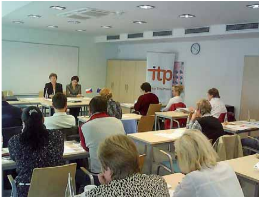
V rámci projektu ITP se v prostorách Úřadu práce ve Frýdku-Místku uskutečnily semináře pro zaměstnavatele.

MARKÉTA UHROVÁ ÚŘAD PRÁCE VE FRÝDKU-MÍSTKU