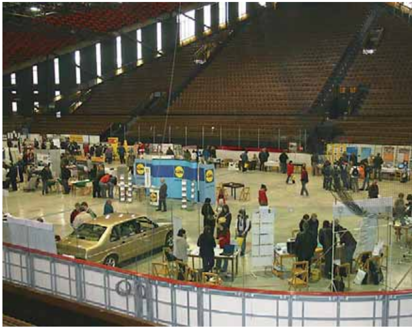
Trh pracovních příležitostí, který se uskutečnil v dubnu t. r. ve Víceúčelové sportovní hale ve Frýdku-Místku, byl nejvýznamnější akcí projektu ITP – na prezentaci 45 zaměstnavatelů se přišlo podívat dva tisíce návštěvníků.

Úřad práce ve Frýdku-Místku se od června loňského roku do konce listopadu tohoto roku úspěšně podílel na realizaci projektu Evropského sociálního fondu s názvem Institut trhu práce – podpůrný systém služeb zaměstnanosti (dále ITP). Spolu s dalšími partnery, kterými byly úřady práce v pěti pilotních krajích ČR, Národní vzdělávací fond a Hospodářská komora ČR, byly v rámci tohoto projektu vyvíjeny činnosti k posílení služeb zaměstnanosti a rozšíření aktivit na trhu práce.