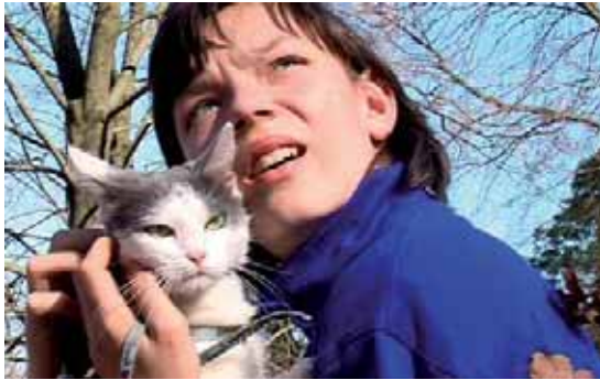
Čtrnáctiletý chlapec ze severních Čech je hlavní postavou filmu Tak to vidím já – Pepa .

Až do 18. března probíhá v Praze již 12. Mezinárodní festival dokumentárních filmů o lidských právech JEDEN SVĚT. Pokud to nestihnete do Prahy, v průběhu března a dubna můžete festivalové snímky zhlédnout v dalších 29 městech po celé České republice. Na letošní festival přihlásili tvůrci 101 dokumentů z více než třiceti zemí celého světa.