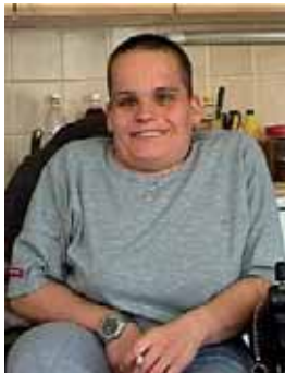
Film Nevtání je povzbudivým svědectvím, že silnou vůlí se dá bojovat proti nepřizní osudu.

Kromě filmů vybraných do hlavní soutěže a speciální soutěžní kategorie Máte právo vědět jsou představeny další snímky v tematických sekcích: Zaostřeno na Irán, Zelené výzvy (ekologie a životní prostředí), Snášenliví – nesnášenliví (rasismus, nacionalismus a neonacismus v Evropě), Zenským hlasem (problémy, se kterými se potýkají ženy v různých zemích světa), Za svým snem (příběhy života na okraji společnosti nebo v ghettech), České dokumenty či Panorama (snímky reflektující jak celospolečenské problémy současného světa, tak zajímavé osobní příběhy). Diváci Jednoho světa mají i letos příležitost vidět vybrané dokumenty on-line prostřednictvím streamování na stránkách www.ceskatelevize.cz/jedensvet (do 28. 3.).