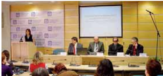
Tisková konference, na které byl projekt Vzdělávání k profesionalitě v sociálních službách představen novinářům, se uskutečnila 15. února na Ministerstvu práce a sociálních věcí ČR.

Výuka zahrnuje 120 hodin teoretické přípravy a 30 hodin praxe. Celkem se bude konat 16 kurzů, na jejichž realizaci se má podílet 140 lektorů v 8 krajích. Výukové předměty bude garantovat 16 odborníků z řad psychologů, psychiatrů, zdravotních sester, lékařů, sociálních pracovníků, ergoterapeutů, hygieni-