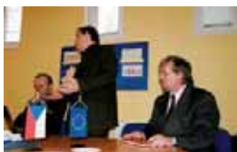
Prezentace výsledků studie na poradě vedení systému inspekce práce 29. ledna v Jihlavě.

Výsledky projektu CZ.1.04/4.1.00/32.00007 jsou uveřejněny na webo-