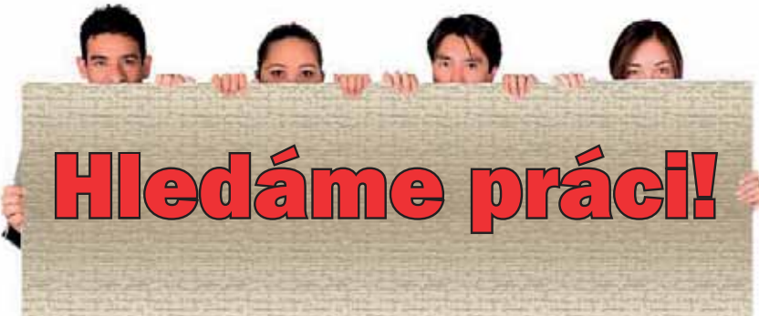
Projekty Úřadu práce v Ostravě úspěšně pomáhají zejména dlouhodobě nezaměstnaným a těm, kteří vstupují na trh práce s nějakým handicapem.

Úřad práce v Ostravě realizuje čtyři regionální individuální projekty, které mají pomoci celkem 3 200 lidem bez práce. Společným cílem projektů Návrat+ , Start , Příprava+ a Změna včas je zvýšit teoretické i praktické dovednosti, zprostředkovat pracovní uplatnění a podpořit pracovní místa.