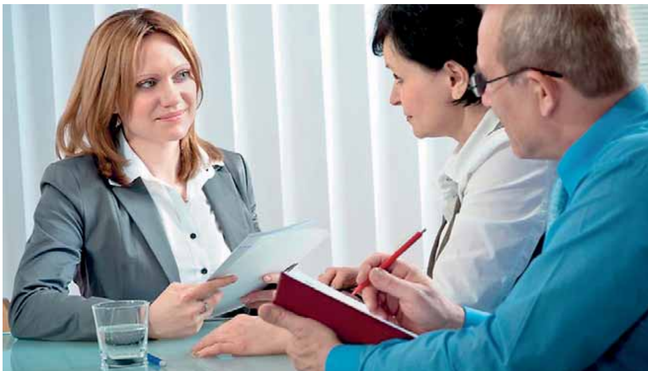
Uchazeče o zaměstnání při pracovních pohovorech často diskvalifikuje neznalost vlastního potenciálu a jeho praktického využití.

Na posouzení uplatnitelnosti má také vliv poptávka na trhu práce a regionální závislost, resp. nezávislost uchazeče („regionální flexibilita“). Často uchazeči dokážou „hledat“ zaměstnání v místě, kde prostě není, a pasivně čekají i několik let, zda se