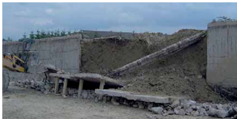
Panely, pod nimiž skončily životy dvou lidí.

Určení odpovědnosti za vznik pracovních úrazů bude vzhledem ke slo-