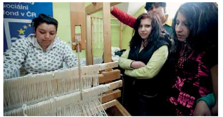
Nová Naděje má za cíl ukázat mladým lidem z vyloučených romských lokalit, že najít a udržet si práci není až tak složité.

Většina vyloučených romských lokalit vznikla během posledních deseti let. Chlapci a dívky žijící v takovém prostředí neměli šanci poznat jiné podmínky a jiný způsob života, založený na práci, kvalifikaci a pravidelné mzdě. Znájí jen život v nezaměstnanosti, z dávek a v lokalitě, kde takto žije většina lidí. Vyloučení Romů se tak začíná „dědit“.