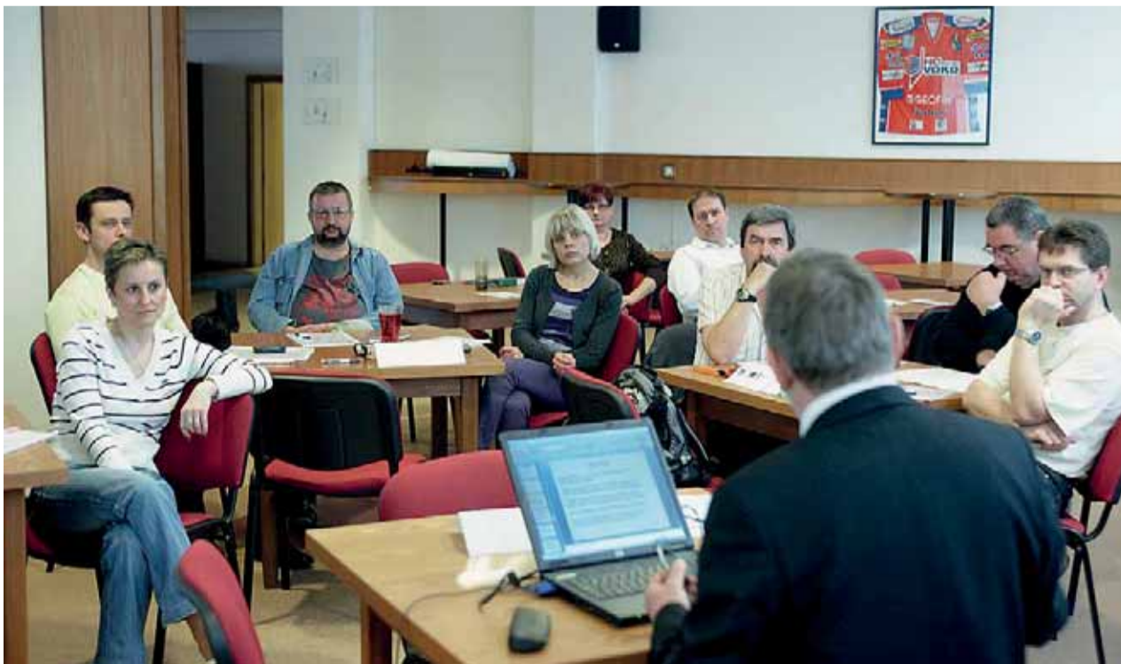
Celkem 65 zaměstnanců společnosti se v rámci projektu zdokonalí v manažerských dovednostech, práci na počítači nebo v angličtině.

Realizátoři připravili pro všechny zájemce několik druhů kurzů zaměřených na teorii i praxi. Jejich smyslem je ukázat mladým lidem jiné způsoby existence. Vysvětlit jim, že najít si a udržet práci není až tak složité, a pokud se jim povede zařadit se do běžné společnosti, rozhodně na tom budou lépe. „Lidé musí něčemu podstatnému věřit. To dokazují nejen dějiny národů, ale i každodenní reálný život nás všech. Jsme přesvědčeni, že i podpora z našeho kraje, Ministerstva práce a sociálních věcí ČR a nakonec i z Úřadu vlády ČR jsou hlasem Nové Naděje,“ zdůrazňují organizátoři. (KB)