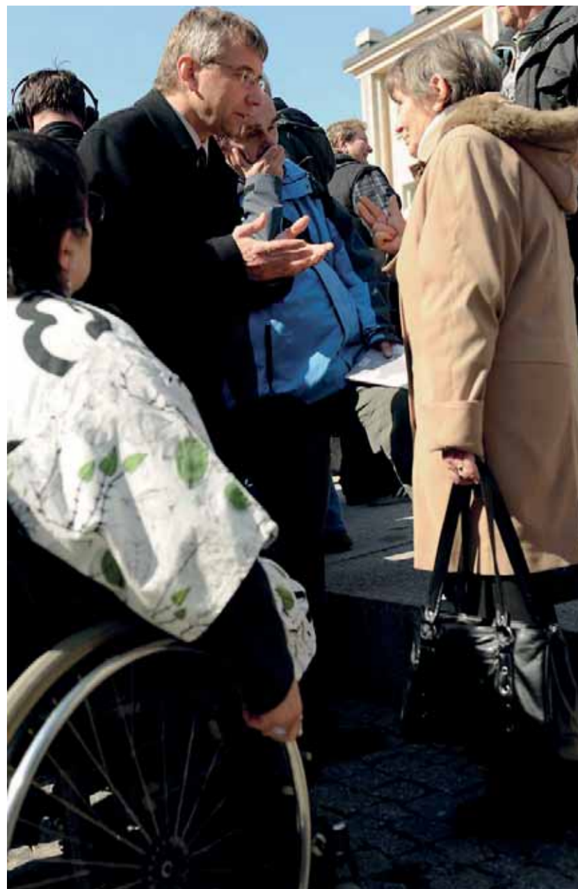
„Rozumím tomu, že pokud někdo tvrdí, že budeme rušit ZTP průkazky či odebrat možnost hradit z příspěvku na péči pomoc blízké osoby, pak to v lidech budí nevoli. Nic takového se ale nekoná, nechystá a neplánuje,“ říká ministr práce a sociálních věcí Jaromír Drábek.